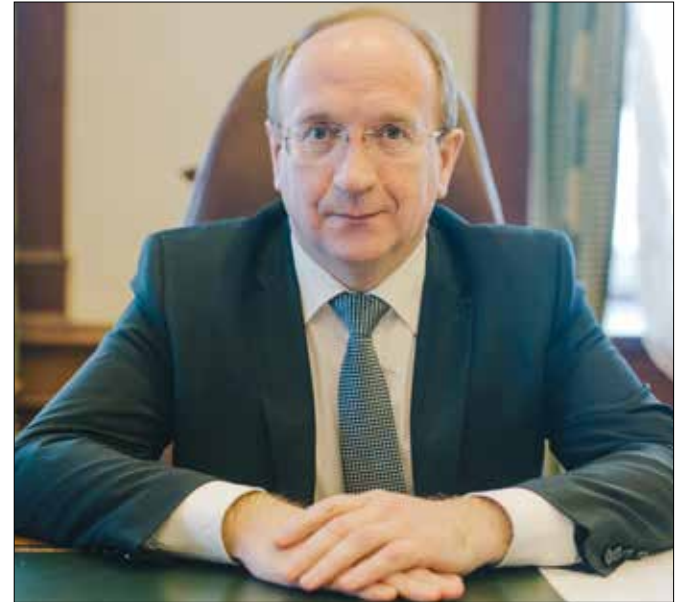
Александр Кузьмичёв, председатель Ивановской городской думы

Представитель подрядной организации отметил, что работы удалось выполнить раньше установленного контрактом срока. Он добавил, что малые архитектурные элементы, смонтированные в сквере, выполнены из термобруса. Этот материал долговечен и подходит для наших погодных условий. На все работы предусмотрена гарантия – пять лет РК