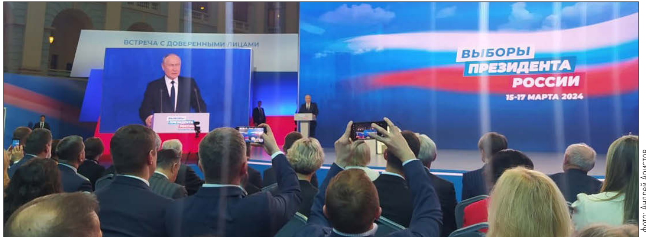
▲ Владимир Путин призвал своих доверенных лиц к живому общению с людьми

В Москве состоялась встреча Владимира Путина со своими доверенными лицами, в которой приняли участие и доверенные лица Президента из нашей области. О том, как прошла встреча, они рассказали волонтерам регионального штаба Президента, вернувшись в Иваново