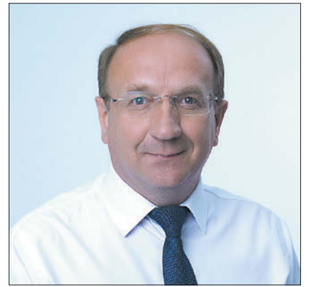
Александр Кузьмичёв, председатель Ивановской городской думы