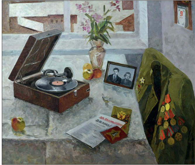
▲ Яков А.П. День Победы, 2010

На выставке «Мужицкая ноша» (см. материал о ней слева) представлены в том числе портреты участников Великой Отечественной войны. Некоторые зарисовки сделаны в промежутках между боями. Но как сложилась дальнейшая жизнь изображенных? Что делал на фронте художник? Благодаря оцифровке военных архивов сегодня можно попытаться ответить на эти вопросы