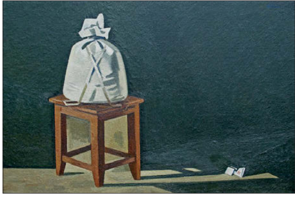
▲ Коверин А.В. Мужицкая ноша, 2004