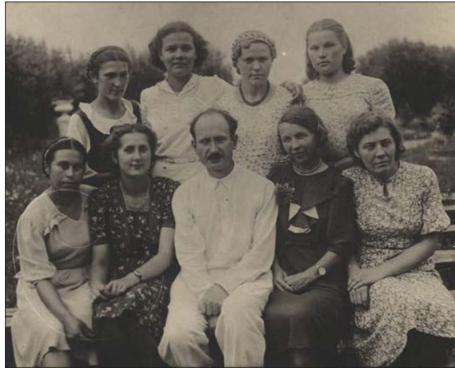
▲ Выпуск 1943 года

Помимо голода мучил холод. Постоянный. Бабушка описывала время учебы в мединституте: «Высокие потолки, большие помещения, которые плохо отапливались. Сидели в одежде. Пальцы замерзали, даже держать ручку было тяжело. Но мы учились из последних сил – внутренний настрой на то, что ты готовишься спасти жизни бойцам, заставлял организм работать на пределе».