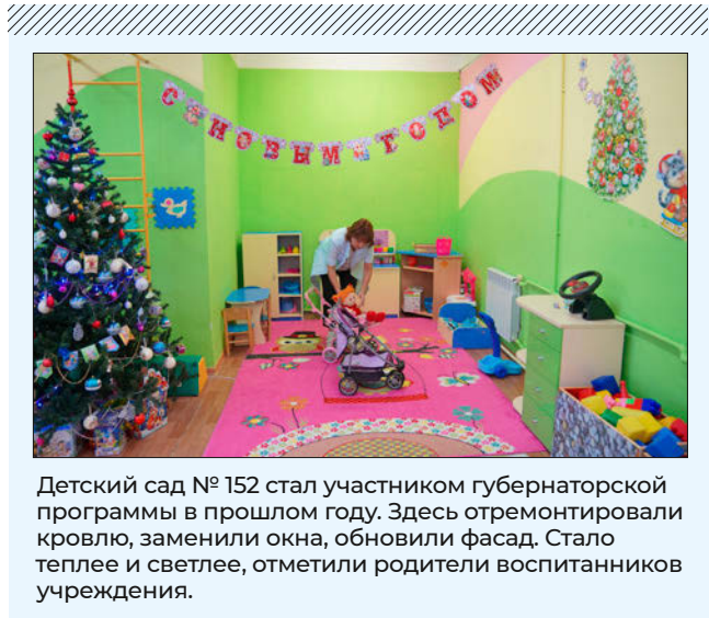
Детский сад № 152 стал участником губернаторской программы в прошлом году. Здесь отремонтировали кровлю, заменили окна, обновили фасад. Стало теплее и светлее, отметили родители воспитанников учреждения.