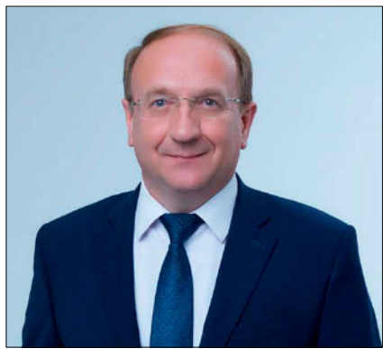
Александр Кузьмичёв, председатель Ивановской городской думы

С подробной информацией об условиях награждения знаком «Общественное признание» можно ознакомиться на сайте www.ivgorduma.ru в разделе «Специальные проекты».