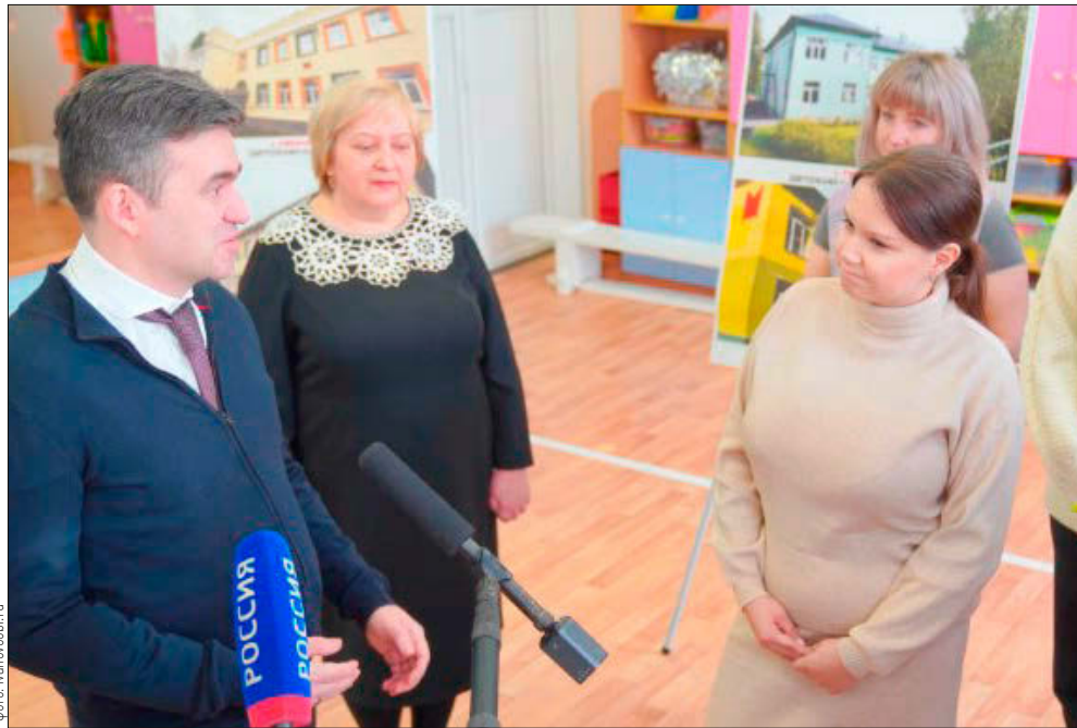
▲ Детский сад комбинированного вида №127 стал одним из 14 садов областного центра, где проведут в этом году ремонт. Учреждение функционирует в этом здании с 1959 года. Здесь открыто семь групп, в том числе две группы компенсирующей направленности для детей от 5 до 8 лет. Всего учреждение посещают 118 воспитанников, коллектив – 21 педагогический работник. В детском саду в 2026 году сделают капитальный ремонт фасада, кровли, цоколя, заменят часть окон.