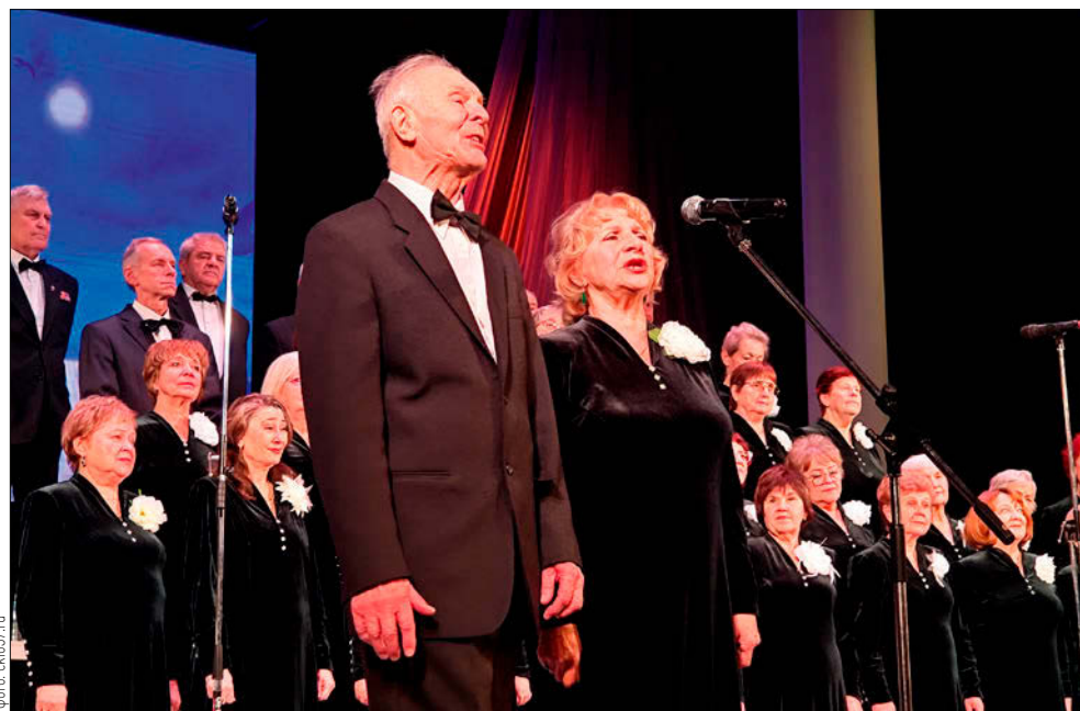
▲ Ивановский хор ветеранов – лауреат Всесоюзного и Всероссийского смотров самодеятельного художественного творчества. За последние 10 лет коллектив завоевал два Гран-при и семь дипломов областных конкурсов патриотической песни «Славим Россию», диплом лауреата Межрегионального конкурса.