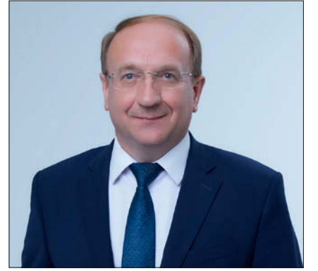
Александр Кузьмичёв, председатель Ивановской городской думы

С 1 апреля запланировано повышение социальных пенсий на 6,8%. С 1 октября предполагается индексация военных пенсий на 4%.