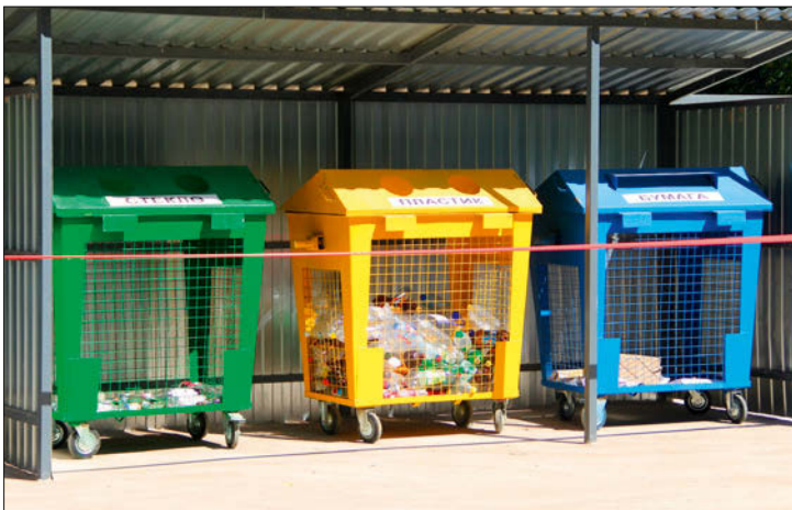
▲ Согласно указу президента Владимира Путина, к 2030 году по всей стране должна быть обеспечена сортировка 100% твердых коммунальных отходов, захоронение минимум половины из них и вовлечение в хозяйственный оборот не менее 25% отходов производства и потребления в качестве вторичных ресурсов и сырья.