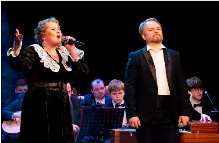
Ивановская областная филармония закрыла юбилейный, 90-й сезон. Как это было и что готовит коллектив сейчас – в нашей публикации