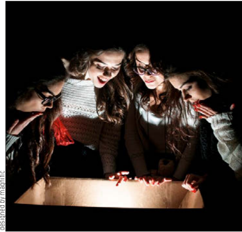
designed by mamific

Долгое время деятельность квестов оставалась в «серой зоне». После трагических инцидентов в разных городах России появился специальный ГОСТ, устанавливающий требования безопасности